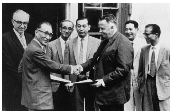
1958年 予研と寿命調査に関する同意書交換