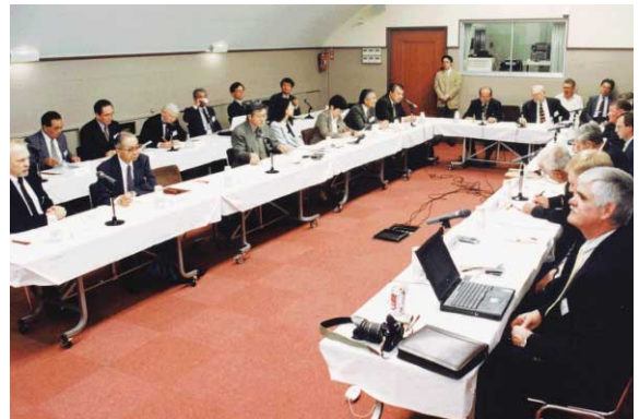
2002年 日米合同線量会議

2002年 4月 日米合同線量再評価実務研究者会議 (新しい計算方式DS02について合意)