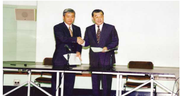
1999年 被爆二世健康調査で二世協と合意

2002年 4月 日米合同線量再評価実務研究者会議 (新しい計算方式DS02について合意)