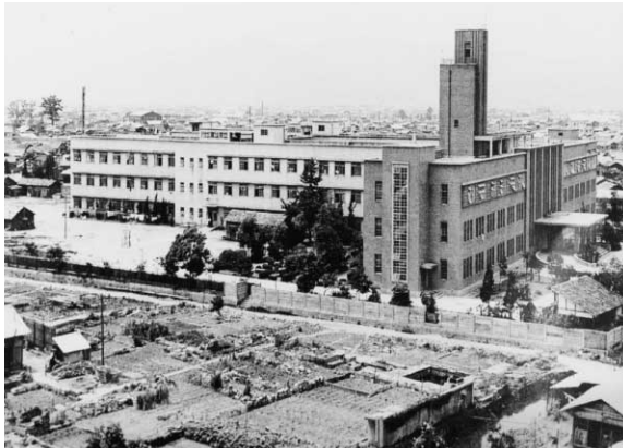
1947年 広島赤十字病院内にABCC開設