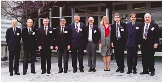
1996年 ブルーリボン委員会開催

1996年 6月 ブルーリボン委員会最終報告書完成 (放影研の将来における調査研究のあり 方について勧告)