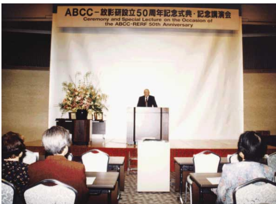
1997年 ABCC - 放影研設立50周年記念式典

1998年11月 ABCC - 放影研長崎研究所設立50周年 記念式典・講演会(長崎)