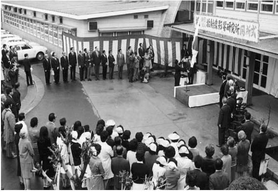
1975年 放影研開所式（広島）