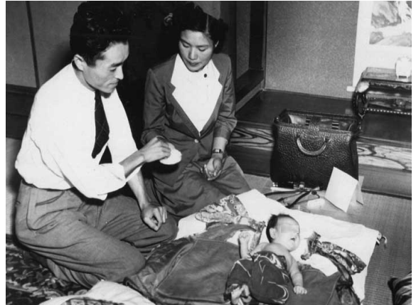
1948年 家庭訪問による調査