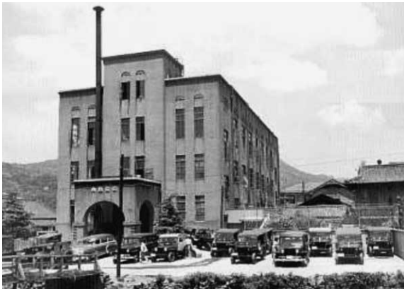
1949年 長崎ABCC、長崎県教育会館へ移転