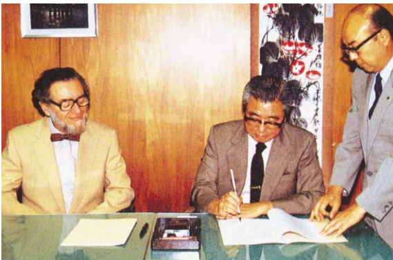
1985年 中華人民共和国工業衛生実験所との研究員交流に関する「覚書」案に合意