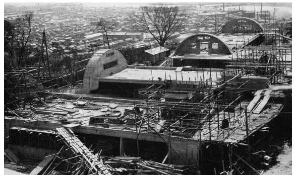
1949年 建設初期の比治山