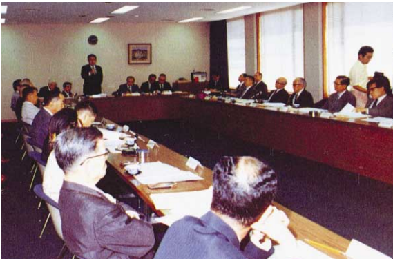
1975年 第1回広島地元連絡協議会開催