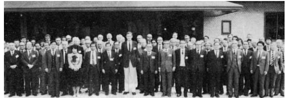
1983年 第1回日米合同原爆線量再評価ワークショップ