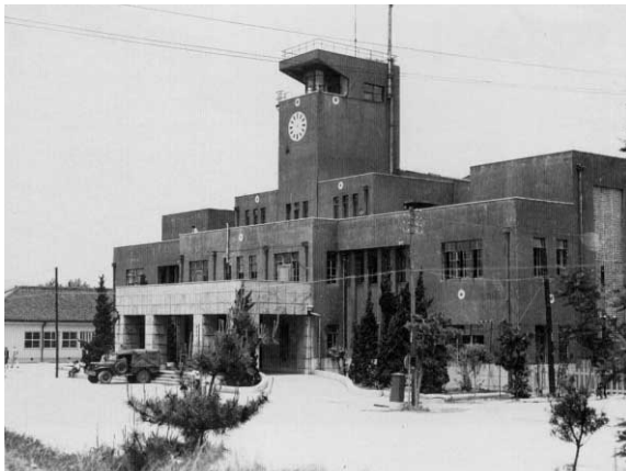
1948年 旧凱旋館に移転